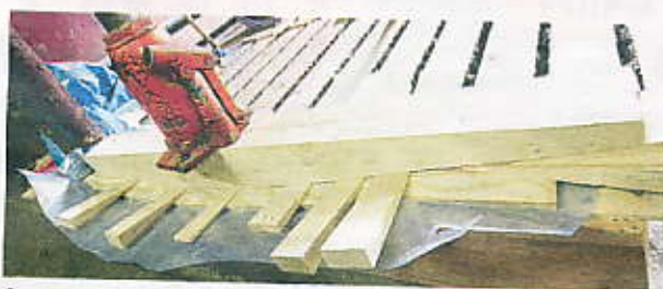
Årbladen limmas och pressas med kilar för att få rätt form.